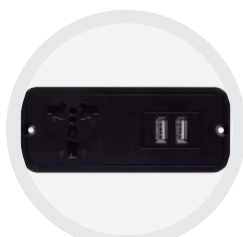
Base Multizona y USB